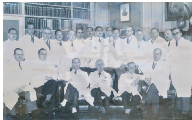
Integrantes del Instituto de Gastroenterologia hacia 1948