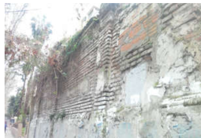
Portón y muro originales en la esquina de Caseros y Pozos