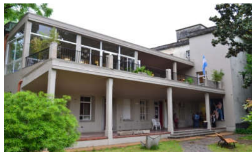
Pabellón C de Oncología

En 1993 el Hospital Nacional de Gastroenterología pasa al ámbito Municipal, y desde 1996 al Ministerio de Salud del GCBA como Hospital de Gastroenterología (con su sigla HBU).