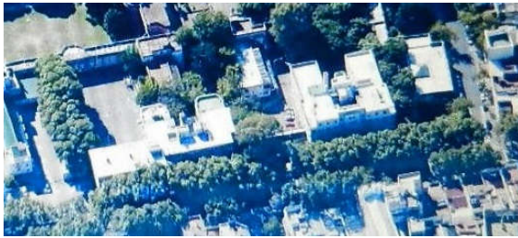
Vista aérea del predio actual