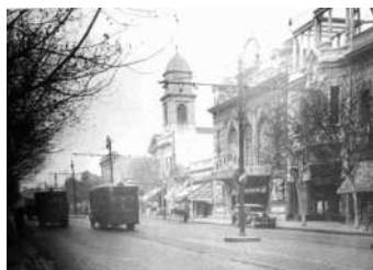
Av. Caseros hacia 1930