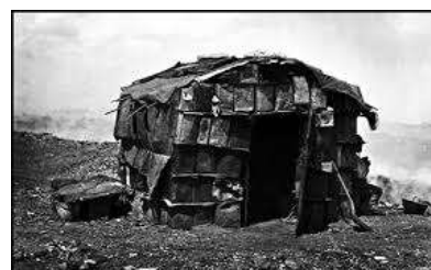
Barrio de Las Latas

Este hospital ocupaba la manzana delimitada por las calles Pozos, Caseros, Pasco y 15 de Noviembre, en lo que fuera la quinta de la familia Navarro Viola, expropiada para tal fin.