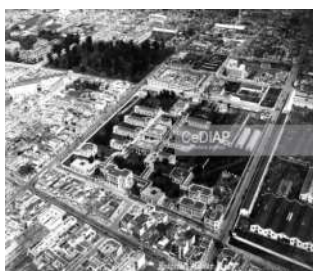
Vista aérea del HMC hacia 1920 y antiguo Pabellón de Tropa