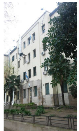
Pabellones racionalistas A y B sobre Av. Caseros