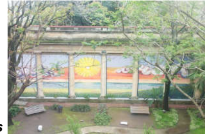
Galería original, hoy amurallada y cubierta con murales artísticos

Luego de este episodio y por razones de seguridad, en 1973 se decide convertir las galerías cubiertas originales en muros de hormigón, con la consiguiente desconexión definitiva del enclave del recién inaugurado CENARESO, ubicado en el terreno contiguo y con acceso sobre Pozos.