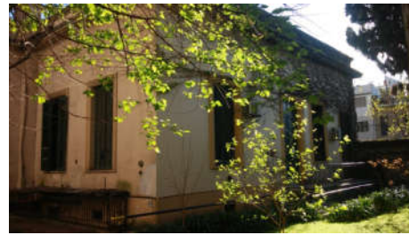
ALUBA, ex Maternidad

Asimismo, entre 1933 y 1934 se construyen dos Pabellones de estilo racionalista (sobre Av. Caseros al 2061 y 2081), a cargo del Ing. Juan Pistarini ; se destinaron para pacientes de la Oficialidad y Suboficialidad, así como para sala de familiares y quirófanos.