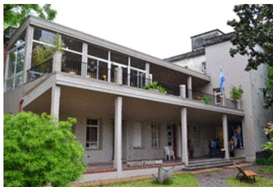
Pabellón C (ex Pabellón de Tropa y CORDIC)