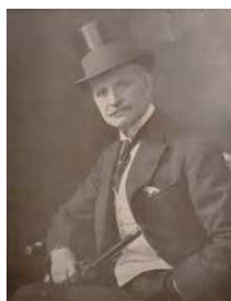
Arq. Francesco Tamburini

Este hospital pabellonado siguiendo el modelo Tollet, muy avanzado para su momento, dejaba amplio protagonismo a sus jardines españoles, que permitían ventilar a la vez que ornamentar el predio.